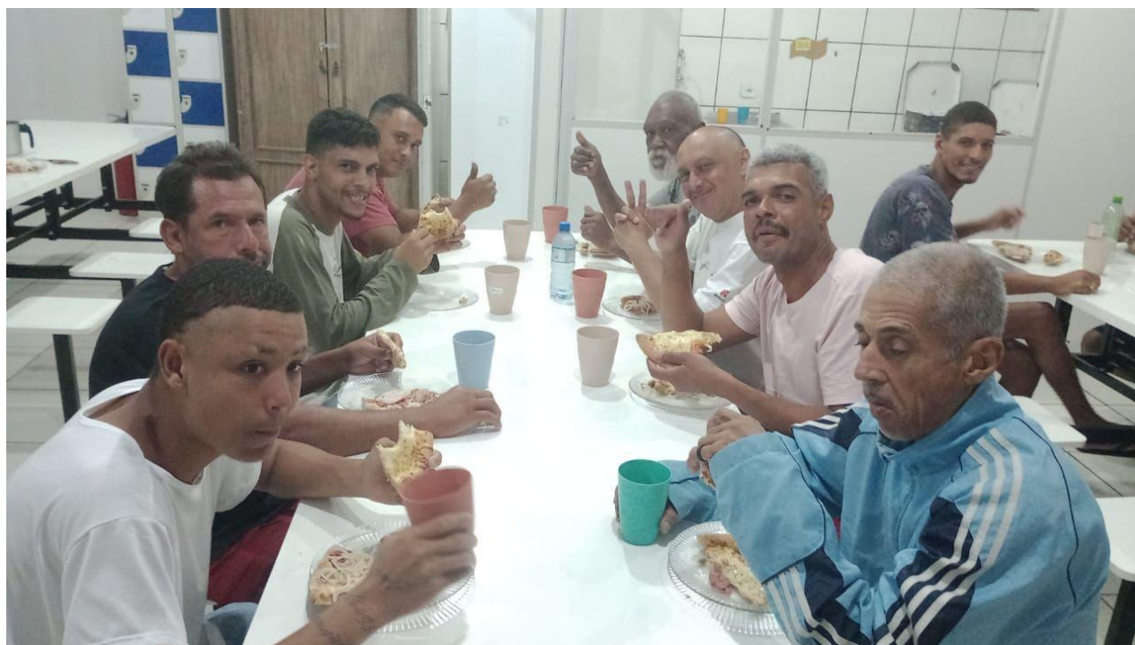
Figura 2: Lanche da Noite