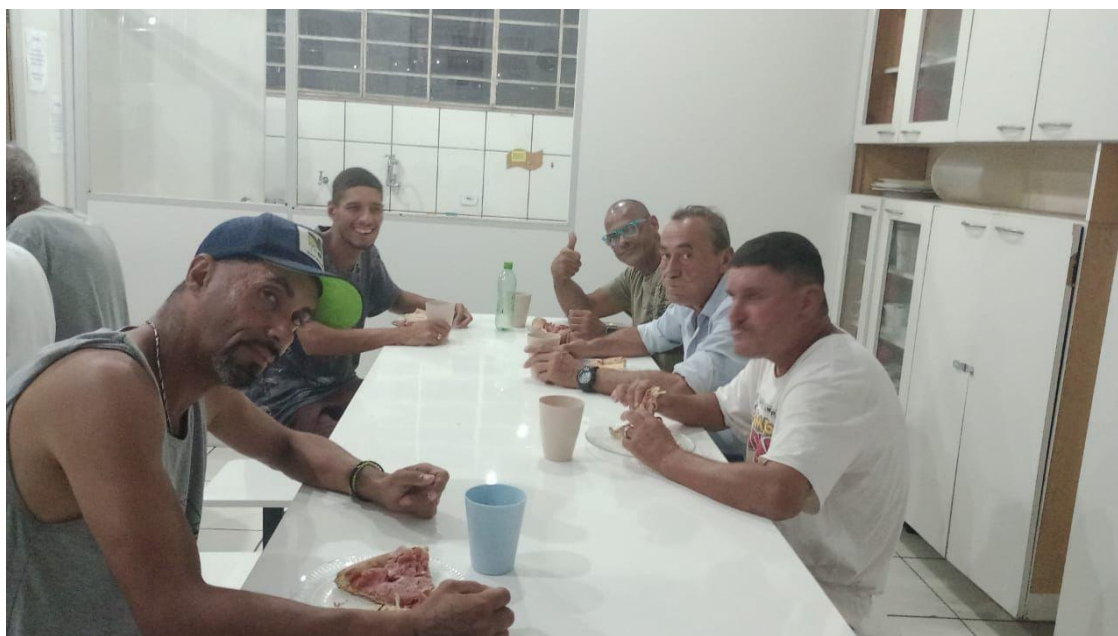
Figura 3: Lanche da Noite