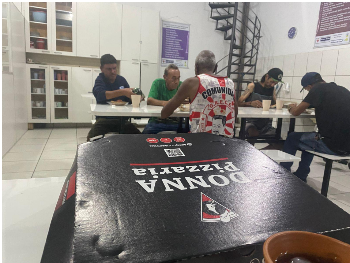
Figura 1: Noite da Pizza, toda as quintas-feiras