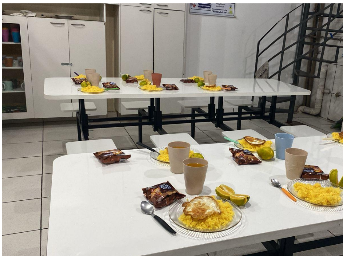
Figura 4: Cuscuz para o lanche da Noite