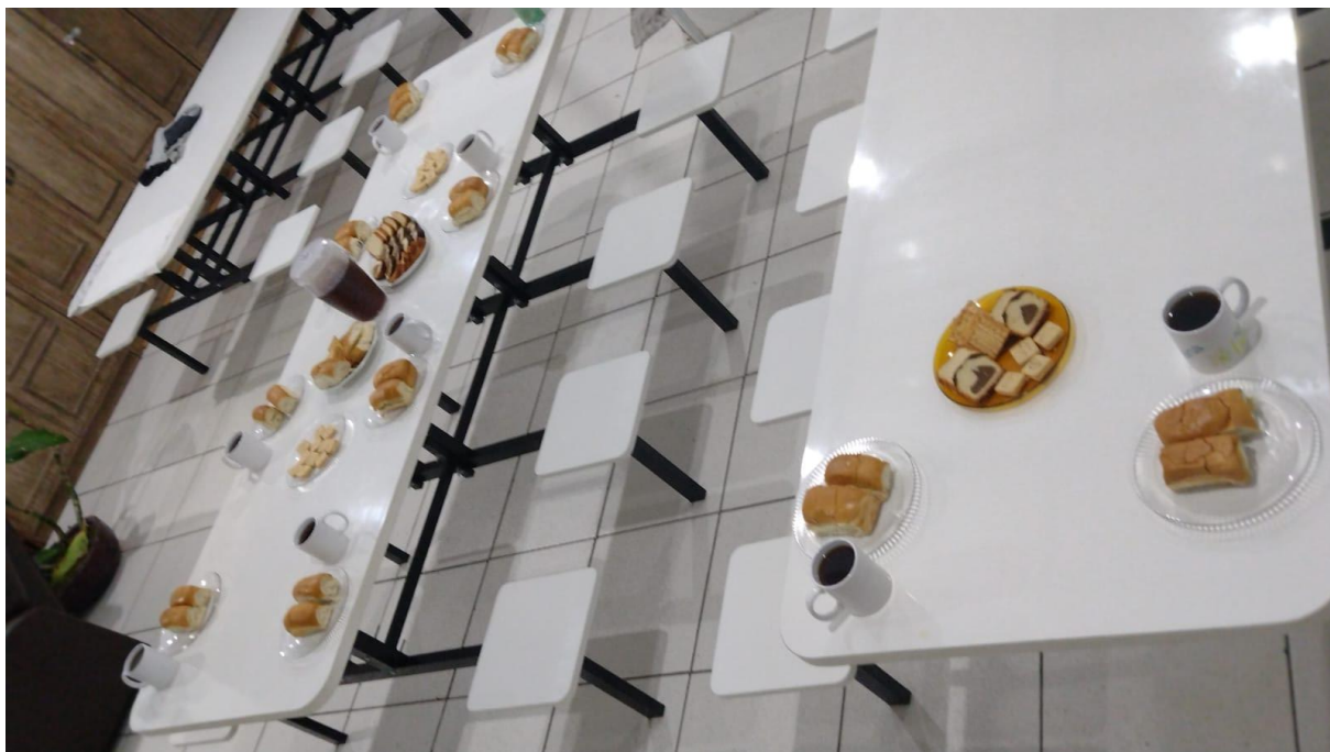
Figura 5: Café da Manhã